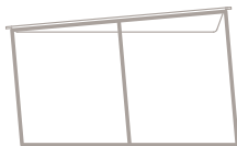
Ø 75cm x h38cm